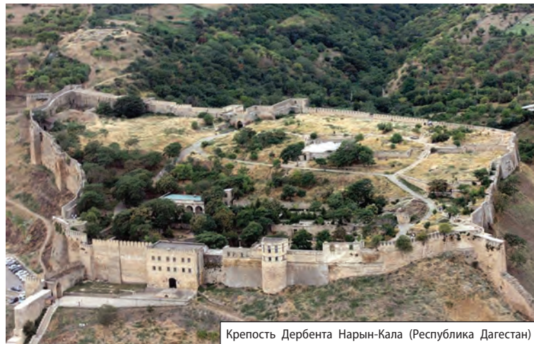
Крепость Дербента Нарын-Кала (Республика Дагестан)