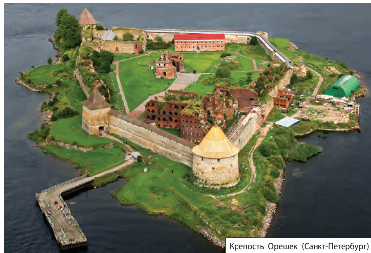
Крепость Орешек (Санкт-Петербург)