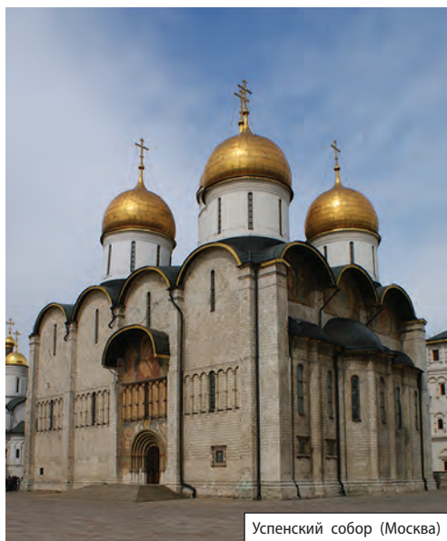
Успенский собор (Москва)